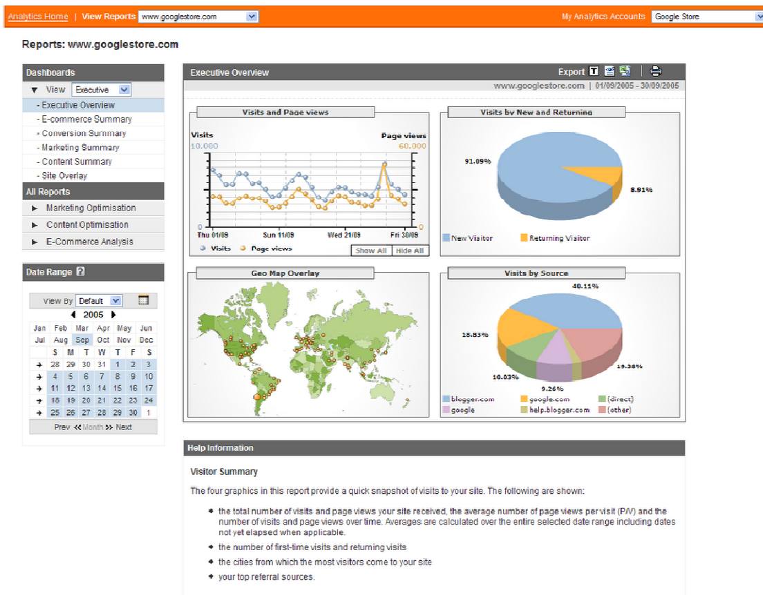
Figur 3 – Voorbeeld van Google statistieken